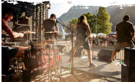
Rock-Konzert am Bike-Event